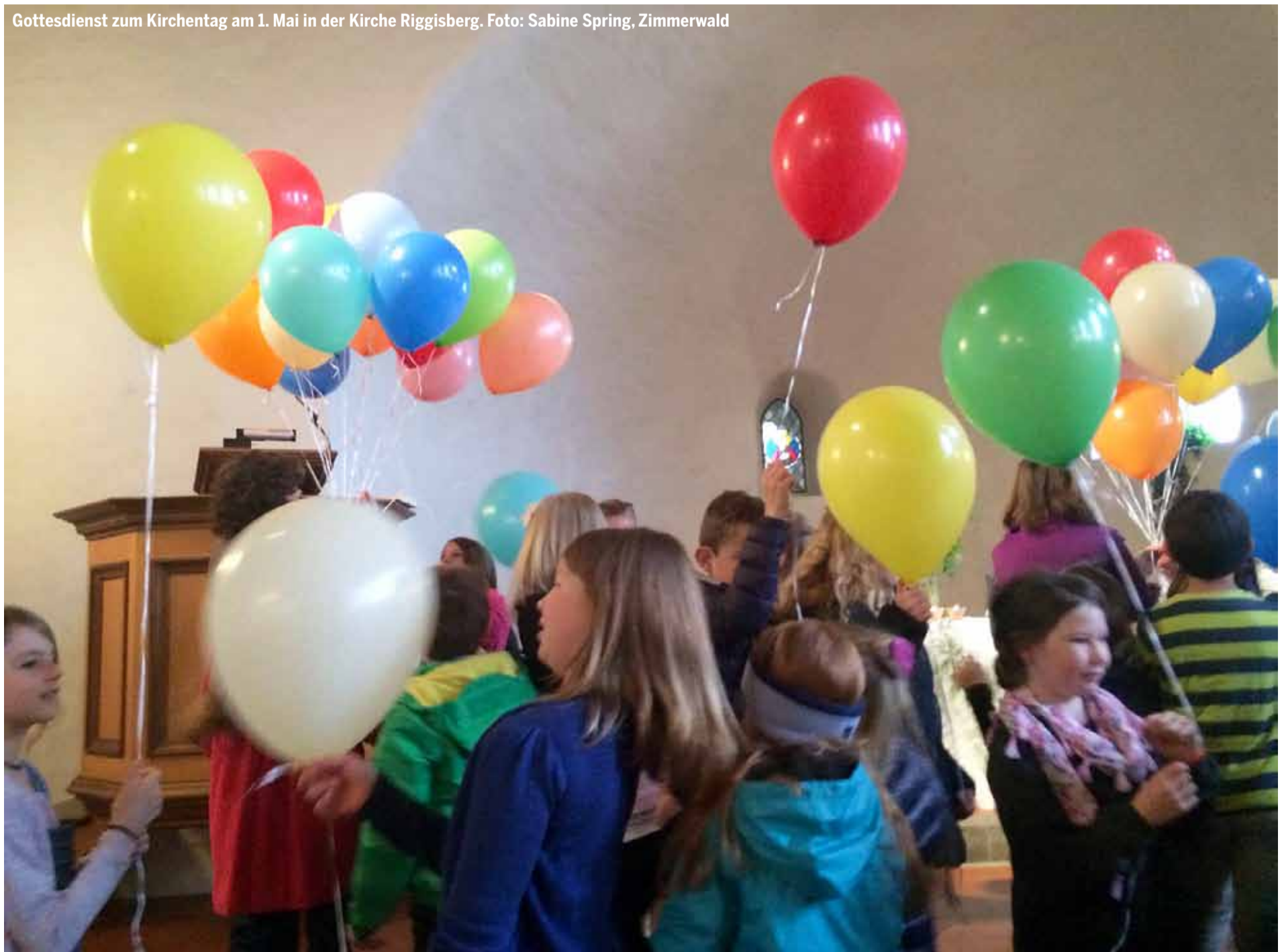
Gottesdienst zum Kirchentag am 1. Mai in der Kirche Riggisberg.